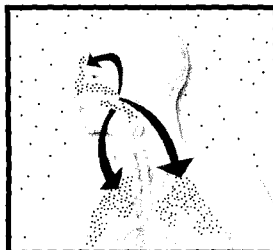
Der Weg der Infektionserreger aus dem Nasen-Rachen-Raum in die Bronchien und Nebenhöhlen

Die Infektion kann dann vom Nasen-Rachen-Raum in die Bronchien absteigen und eine Bronchitis auslösen oder aufsteigen und eine Nasennebenhöhlenentzündung verursachen.