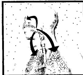
Der Weg der Infektionserreger aus dem Nasen-Rachen-Raum in die Bronchien und Nebenhöhlen

Die Infektion kann dann vom Nasen-Rachen-Raum in die Bronchien absteigen und eine Bronchitis auslösen oder aufsteigen und eine Nasennebenhöhlenentzündung verursachen.